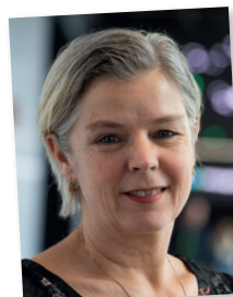
Auteur: Olga Koppenhagen