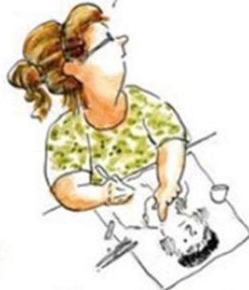
De aangepaste succesvolle leerling