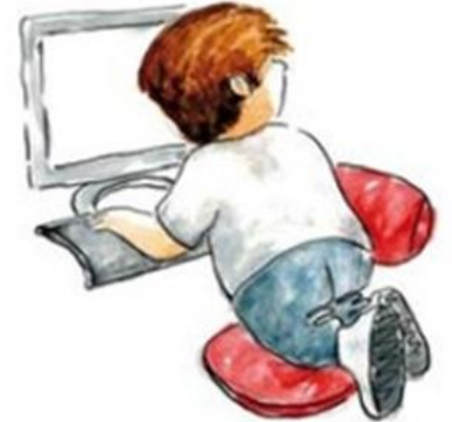
De zelfsturende autonome leerling