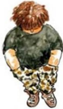
De dubbel bijzondere leerling