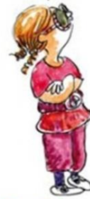
De uitdagende creatieve leerling