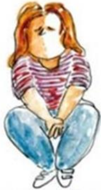
De onderduikende leerling