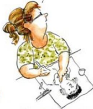
De aangepaste succesvolle leerling