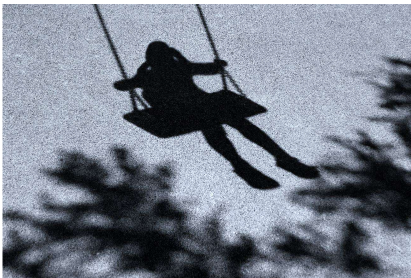
Telkens maar weer dezelfde grapjes te horen krijgen, kan ervoor zorgen dat je vervelend of zelfs onveilig voelt. In de Week tegen Pesten wordt aandacht besteed aan grapjes: Wanneer zijn ze nog leuk, en wanneer wordt het pesten?