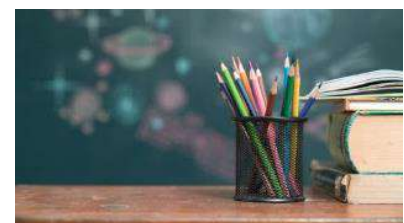
Antipestprogramma's bieden handvatten om pesten aan te pakken en in de toekomst te voorkomen.

Ondanks dat antipestprogramma's werken, blijft een deel van de kinderen slachtoffer. Voor de kinderen die ook ná antipestinterventies nog gepest worden, is de situatie vaak extra vervelend. Voor hen blijkt een aanvullende aanpak nodig, maar het ontwikkelen, uittesten en verbeteren van antipestprogramma's is een langdurig proces. Het is daarom belangrijk dat leerkrachten ook zelf oog houden voor deze 'langdurige' slachtoffers. Ga er niet zonder meer vanuit dat de situatie is opgelost, maar vraag het na en blijf de situatie volgen.