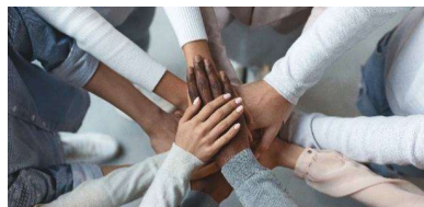
Iedereen betrokken bij het aanpakken van pesten.

Wanneer deze nieuwe definitie van pesten zijn weg naar scholen weet te vinden, kan het er leiden tot vernieuwd begrip: de hele klas, school, buurt en samenleving moet worden betrokken bij de aanpak van pesten, om schade te voorkomen.