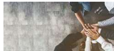
Samenwerken voor een effectieve antipestaanpak.

Pesten aanpakken, dat doe je als ouders en leerkrachten samen.